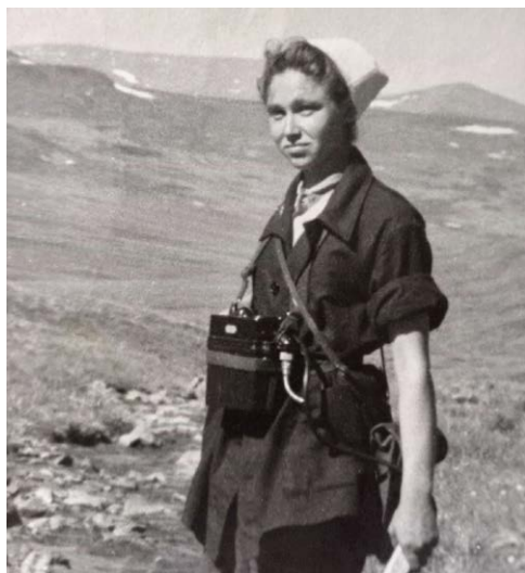
Рис. 3. В маршруте. Чукотка, 1960 г.