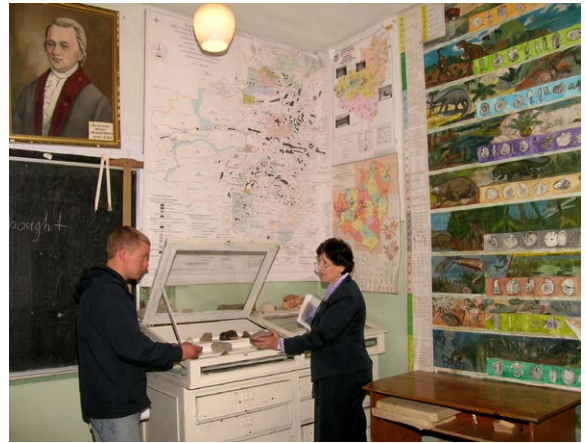
Рис. 7. В кабинете геологии СГСПУ, 2005 г.