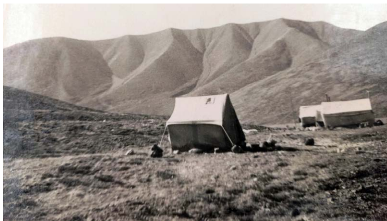
Рис. 4. Лагерь полевой партии. Чукотка, 1960 г.