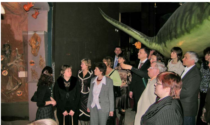
Рис. 12. День геолога в СОИКМ, экскурсия по палеонтологической экспозиции, 30 марта 2007 г.