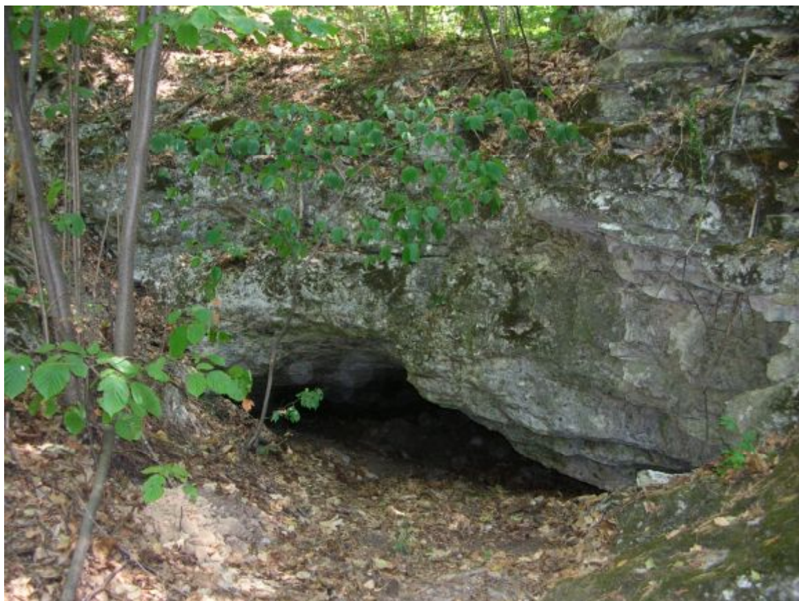
Рисунок 1. Вход в пещеру Стрельненская