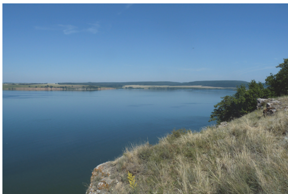
Рис. 1. Вид на Усинский залив со скалы, на склоне которой расположена пещера Вованова

около 0,5 м, далее идет узкий лаз. Общая длина пещеры – 25 м ([4], рис. 3).