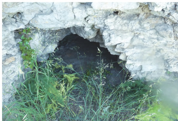
Рис. 2. Вход в пещеру Вованова

В 2 м от входа в пещере был заложен разведочный шурф площадью 0,5×0,5 м и глубиной 0,45 м. Скальное основание шурфом не вскрыто.