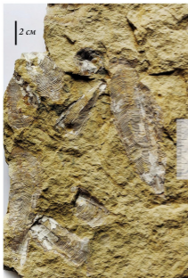
Рис. 3. Фрагмент образца с конулярией Conularia hollebeni ; окрестности с. Русский Байтуган, Самарская обл. ГИМ СамГУ, № П00228, 37,8×21×4,4 см.

Позднее сведения о находках конулярий в том же районе появились в отчёте А.М. Зайцева [4]. Будучи студентом Казанского университета, он в 1878 г. при описании разрезов у с. Байтуган (на берегу р. Байтуган; рис. 2, 3) и у с. Камышла (место находок П.В. Еремеева; рис. 2, 4) среди окаменелостей указал Conularia hollebeni . При этом А.М. Зайцев не привёл описания или рисунков найденных конулярий и отнёсся к находкам как к общеизвестному факту. Вероятно, тогда для определения было достаточно общего вида, изображённого Г.Б. Гейнитцем, и того факта, что она найдена в цехштейне. А.М. Зайцев считал одной из своих задач палеофаунистическое исследование: «...определить в местности подлежащей исследованию, относительные группы пёстрых мергелей к цехштейну, который, как уже было известно, мощно развит по р. Сок» [4].